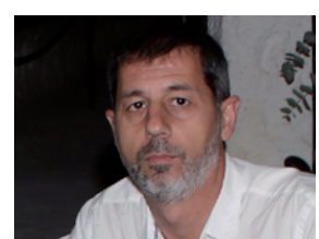
Miguel Ángel Ureña Sáez Fotógrafo