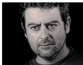
Norberto Vivancos Fotógrafo

“Recuperando las técnicas de fotografía tradicional”